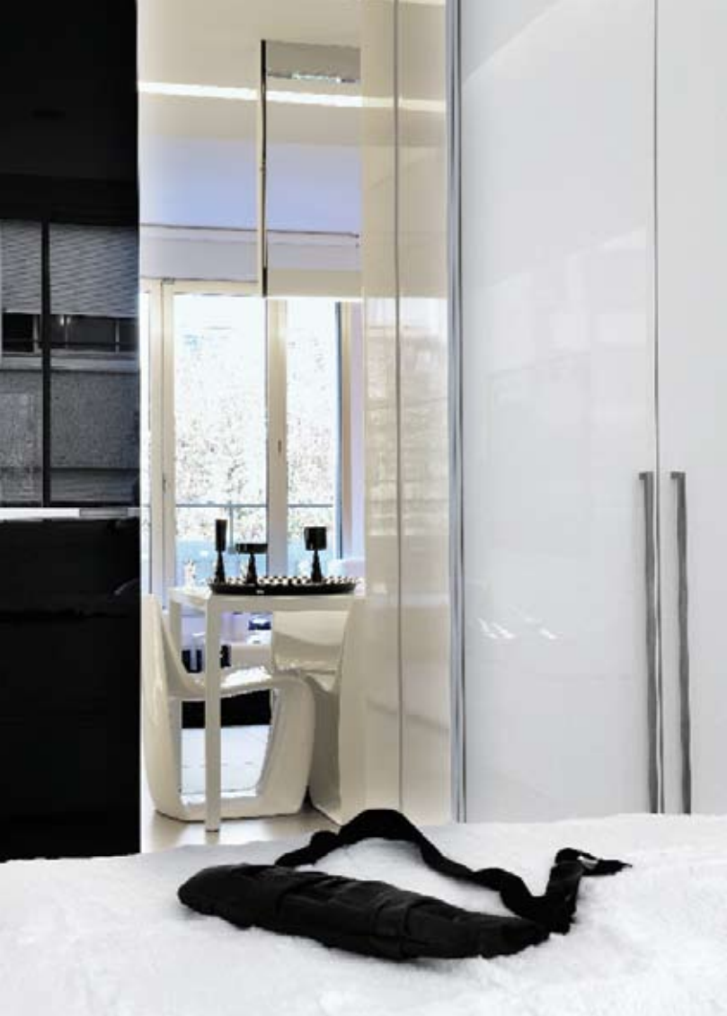
EN SENTIDO HORARIO: En primer plano, bolsa negra de satén; en segundo, mesa Desk de Francesco Bettoni en aluminio y sillas Sign de Piergiorgio Cazzaniga. En la habitación principal, arriba de la cama, escultura Megaron. Adelante del baño ultramoderno aparece la silla Hara de Giorgio Gurioli.