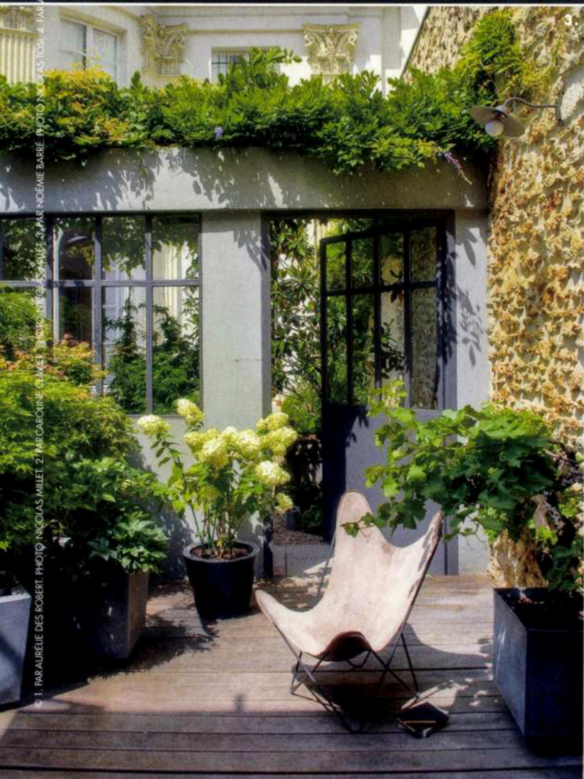
3. PAR AURÉLIE DES ROBERT, PHOTO NICOLAS MILLET. 2. PAR CAROLINE CLAMET, PHOTO NIKÉ CLAS MILLET. 3. PAR NOÉMIE BARRÉ, PHOTO NICOLAS TOSI. 4. PAR AURÉLIE DES ROBERT, PHOTO NICOLAS MILLET.