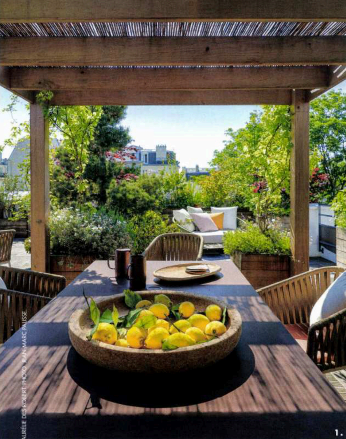
1. PAR AURÉLIE DES ROBERT, PHOTO JEAN-MARC PALISSE.